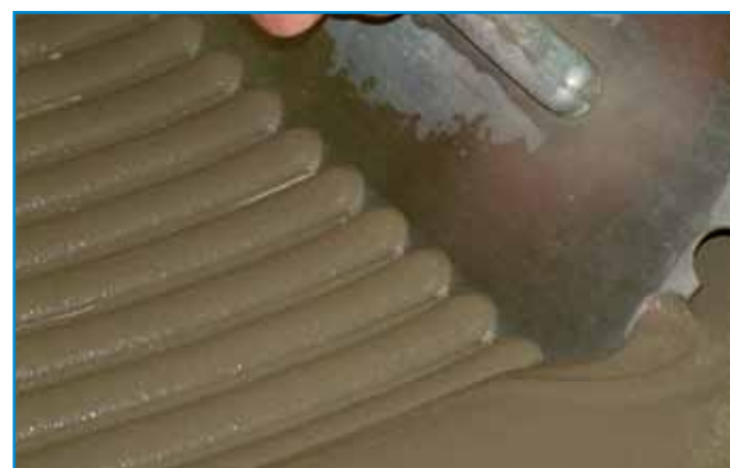
A FließFlex ragasztóhoz a teljes térkitöltés érdekében speciális fogazott glettvast használunk.