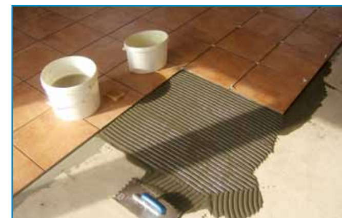
Külsőben és nagy forgalmú belső terekben ideális megoldás a gyorskötésű folyékonyágyazású ragasztó.